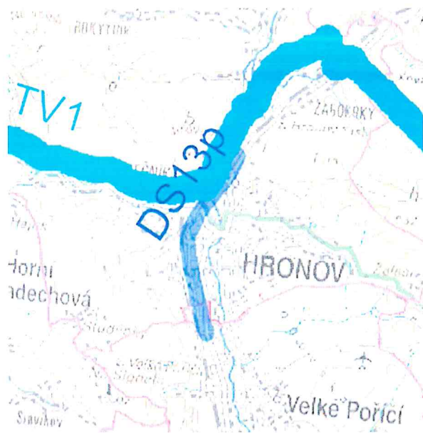
Výřez výkresu Ploch a koridorů platných ZÚR KHK – koridor DS13p v měřítku 1:100 000

V platných ZÚR KHK je vymezován pro přeložku silnice II/303 v prostoru Hronova koridor DS13p, v maximální šířce 180 metrů, a to v měřítku 1:100 000. Tento koridor byl do ZÚR KHK převzat bez věcné změny z Územního plánu velkého územního celku Trutnovsko – Náchodsko. Měřítko zpracování ZÚR neumožňuje identifikovat pozemky dotčené koridorem a ani zde nejsou řešeny žádné konkrétní stavebně technické parametry přeložky silnice II/303.